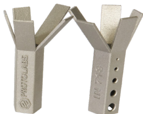
Normale Auflösung 60 µm