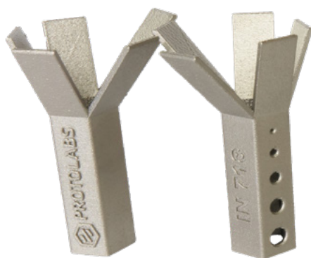
Hohe Auflösung 50 µm